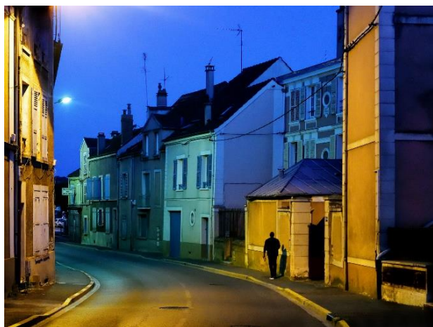
French Town, Jean-Christophe Béchet

Depuis 20 ans, ce double regard sur le monde se construit livre par livre, l'espace de la page imprimée étant son terrain d'expression "naturel". Il est ainsi l'auteur de plus de 20 livres monographiques. Ses photographies sont présentes dans plusieurs collections privées et publiques et elles ont été montrées dans plus de soixante expositions.