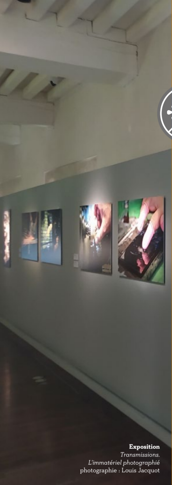
Exposition Transmissions. L'immatériel photographié