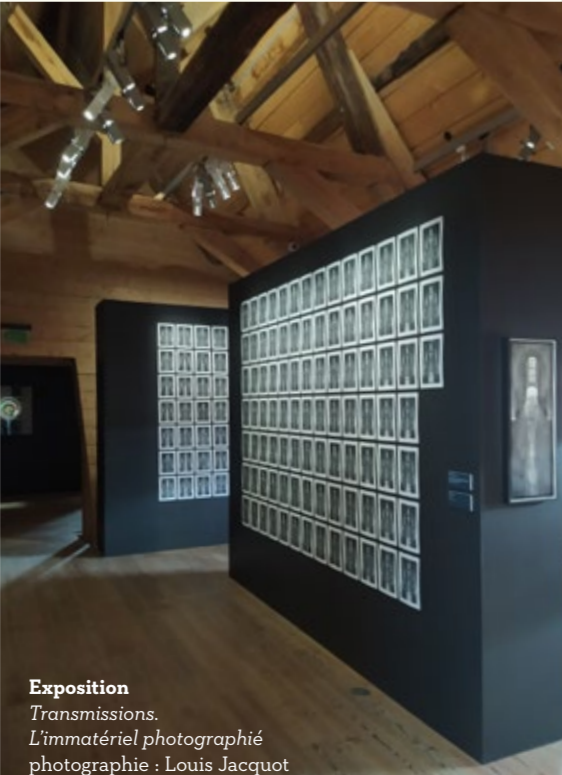
Exposition Transmissions . L'immatériel photographié